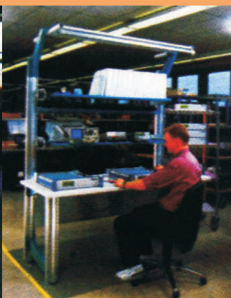
Inspeção e calibração de transmissores de telecomunicação.