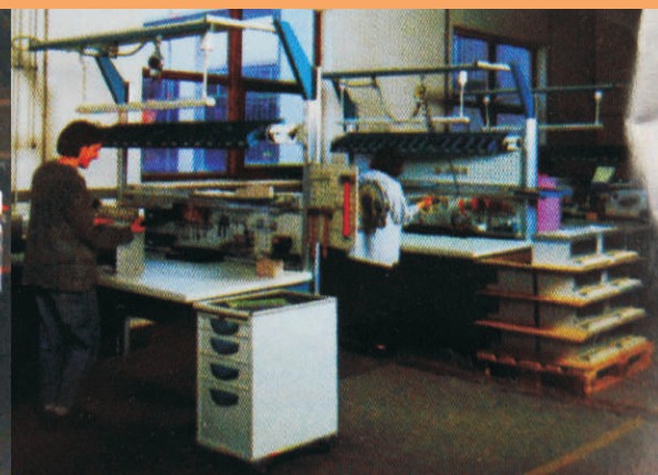
Estações de trabalho para montagens de chassi modulares.