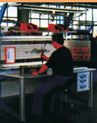
Teste mecânico de módulos elétricos.

soluções específicas para as aplicações com componentes padrão do sistema modular.