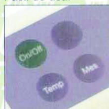
Simples de operar